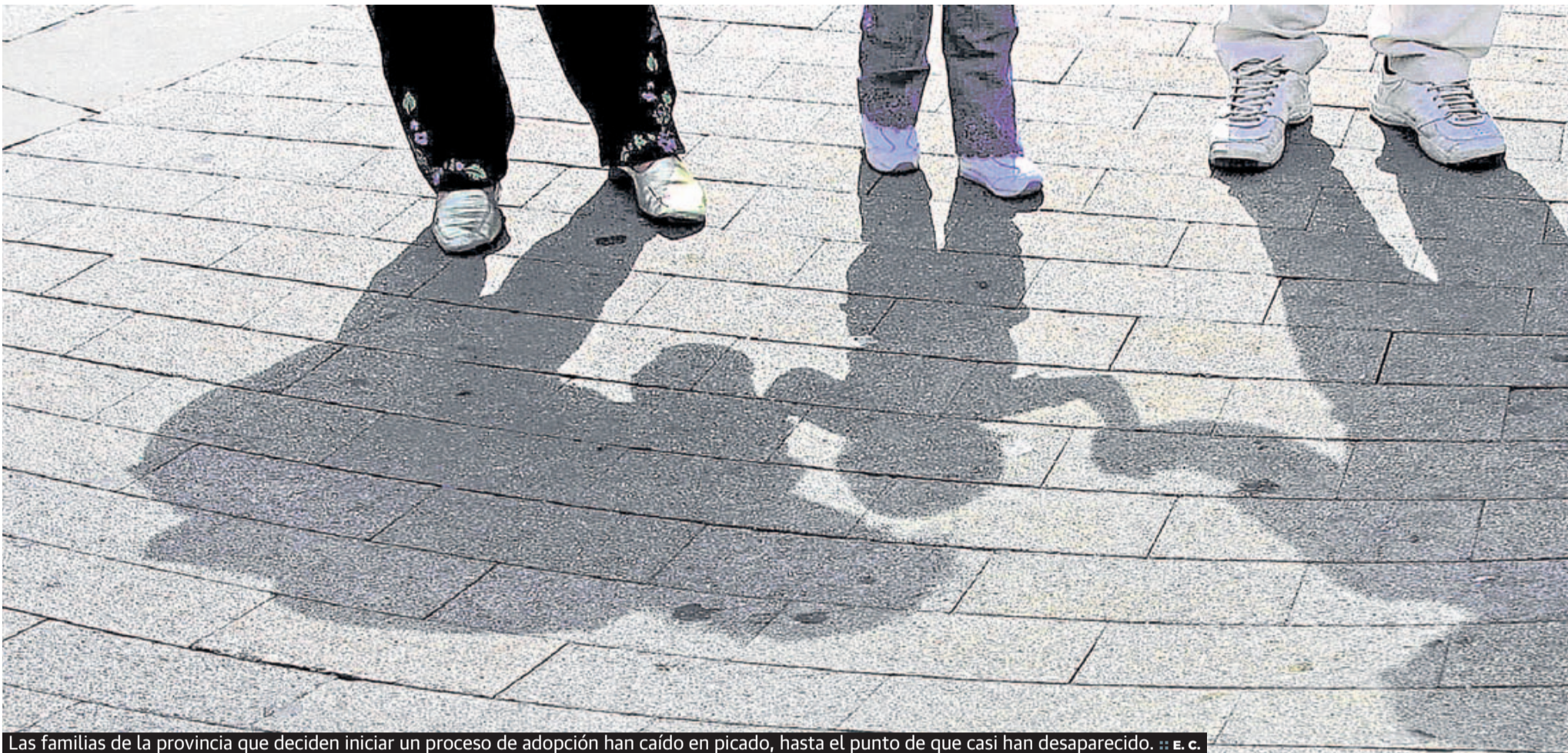
Las familias de la provincia que deciden iniciar un proceso de adopción han caído en picado, hasta el punto de que casi han desaparecido. :: E. C.